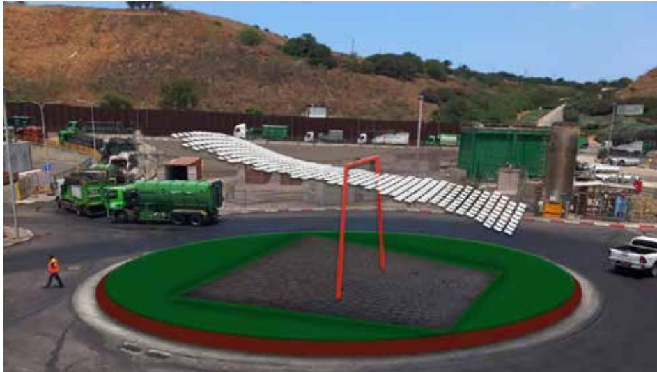
הדמייה פיתוח כיכר אתר חירייה