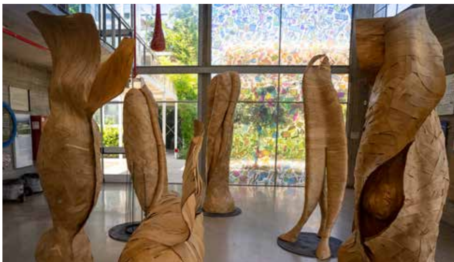
המרכז לחינוך סביבתי - תערוכה "זכרונות גלומים", האמנית אתי גביש דה לנגה