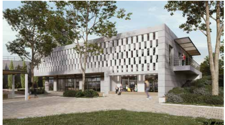
הדמייה משרדי האיגוד החדשים