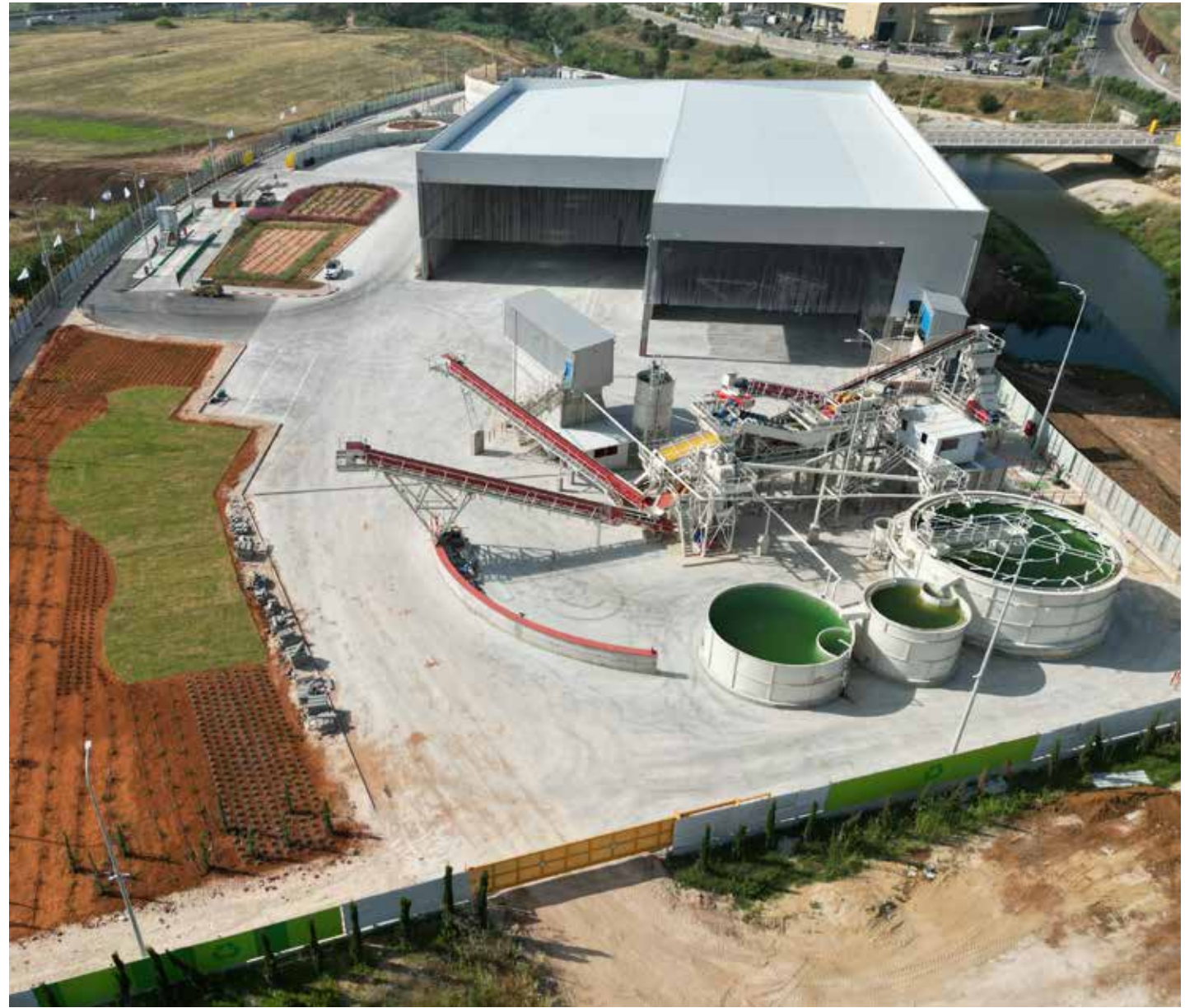
מערכי מיון ושטיפה מהקן פסולת בניין