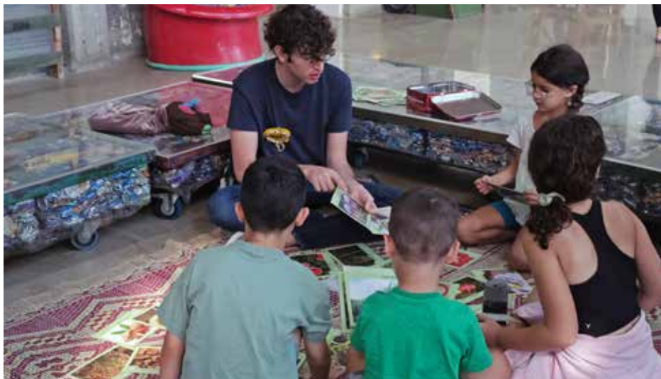
פעילות הדרכה במרכז לחינוך סביבתי 2023