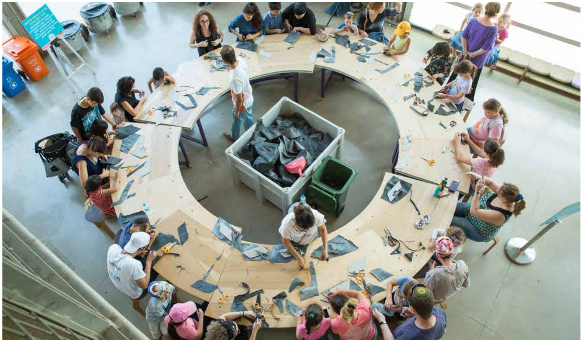
פעילות הדרכה במרכז לחינוך סביבתי 2023