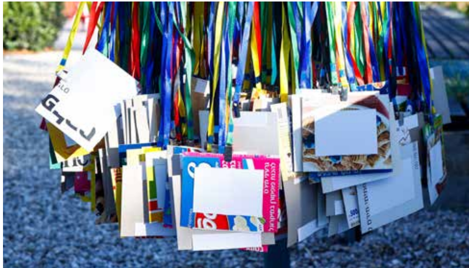
כנס דני שטרנברג ה-6 - תגי שם בשימוש חוזר