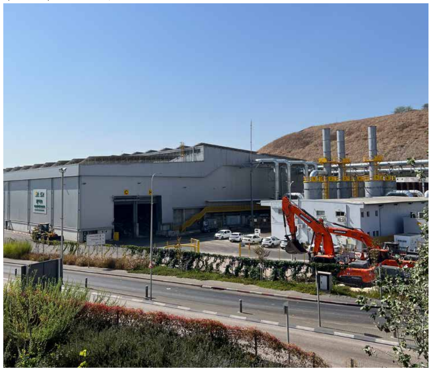
תחנת המעבר המשודרגת והמקורה "מפרידן"