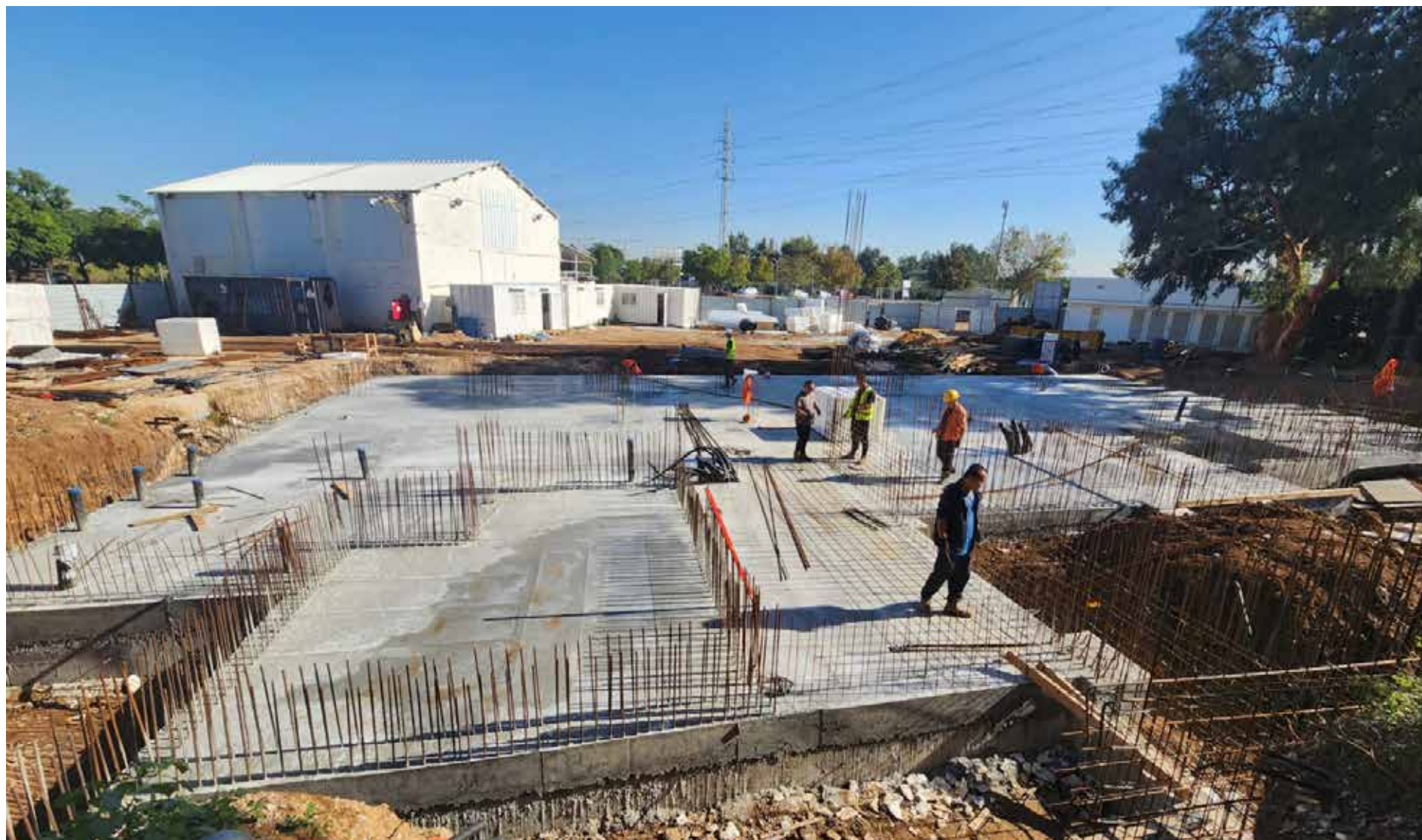
יציקת קומת קרקע משרדי האיגוד החדשים