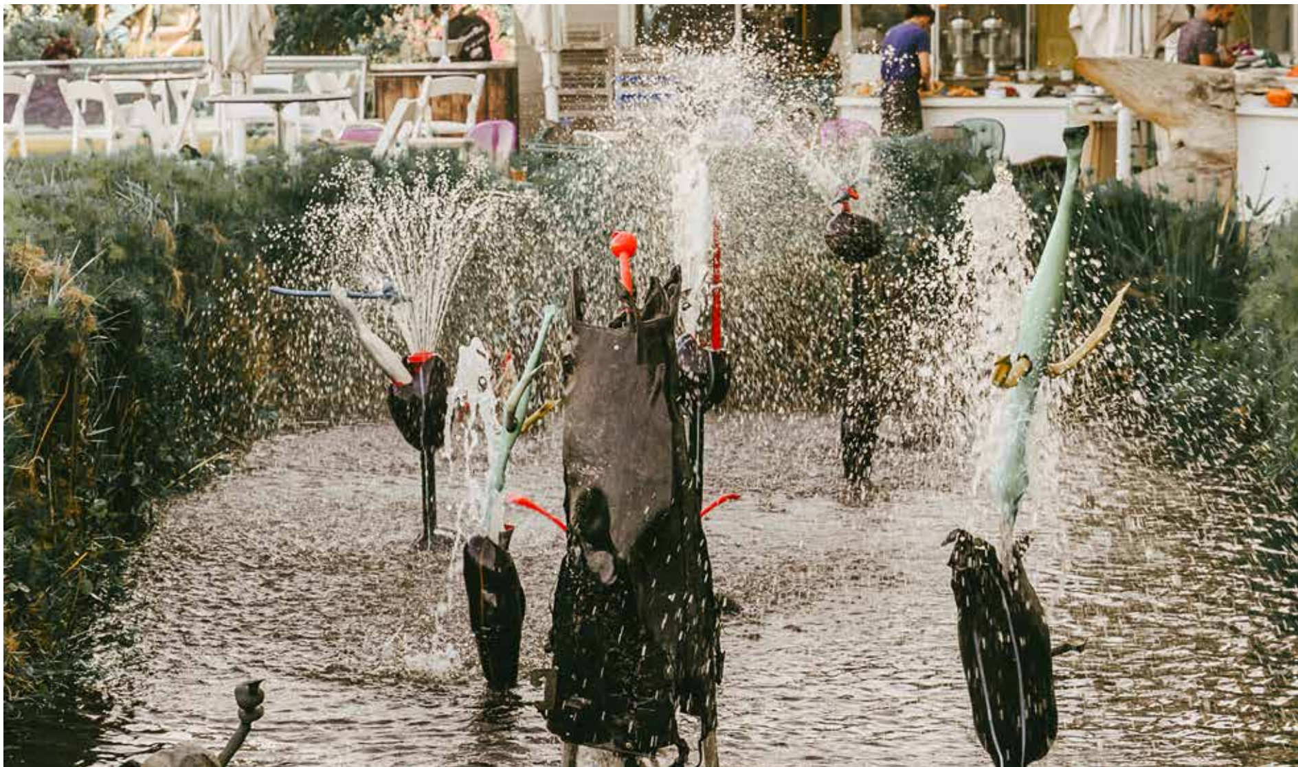
מזרקות מחומרי פסולת בחזית המרכז לחינוך סביבתי, תכנון וביצוע יואב שביט