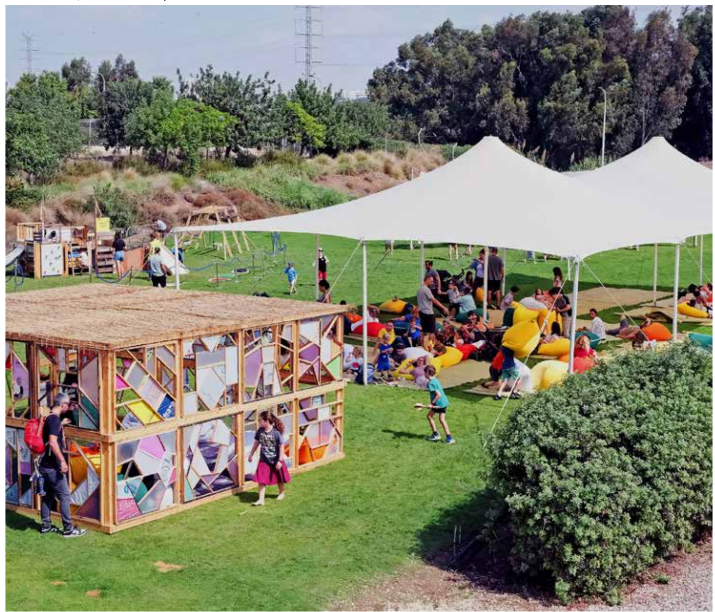
המרכז לחינוך סביבתי - ארועי סוכות 2023