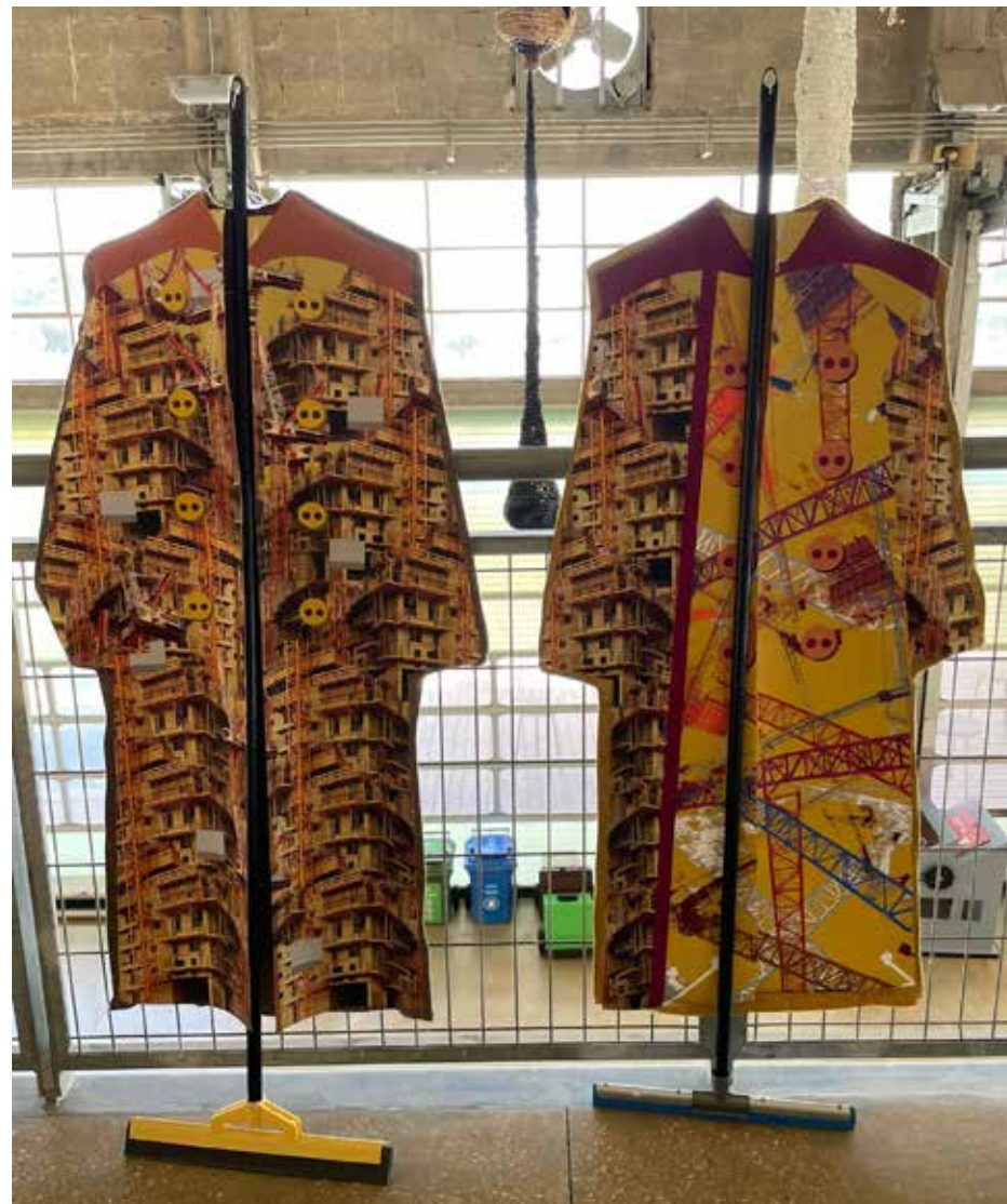
המרכז לחינוך סביבתי - תערוכה "תחנת המעבר" יצירה של האמנית נורית דוד