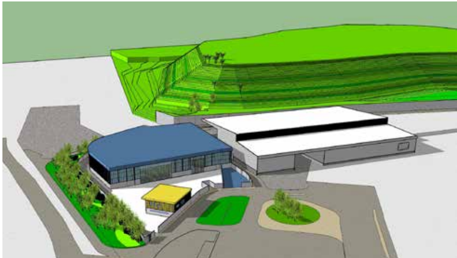
הדמייה מתקן מקורה לטיפול בגזם ופסולת גושית