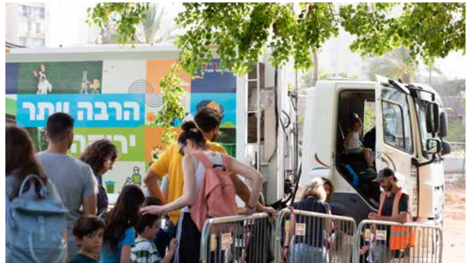
ארוע "חירייה בעיר" גבעתיים