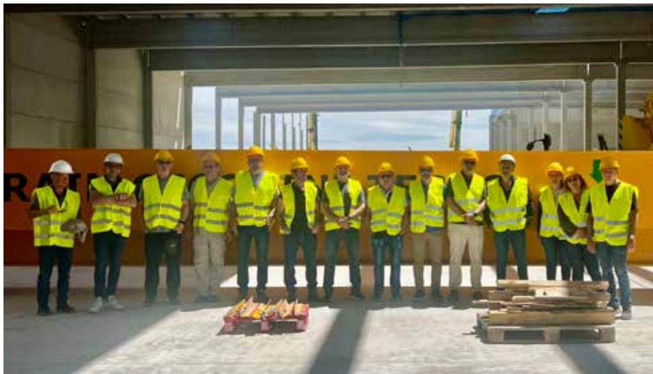
סיור מקצועי, הנהלת האיגוד במפעל למיון פסולת מעורבת - מדריד