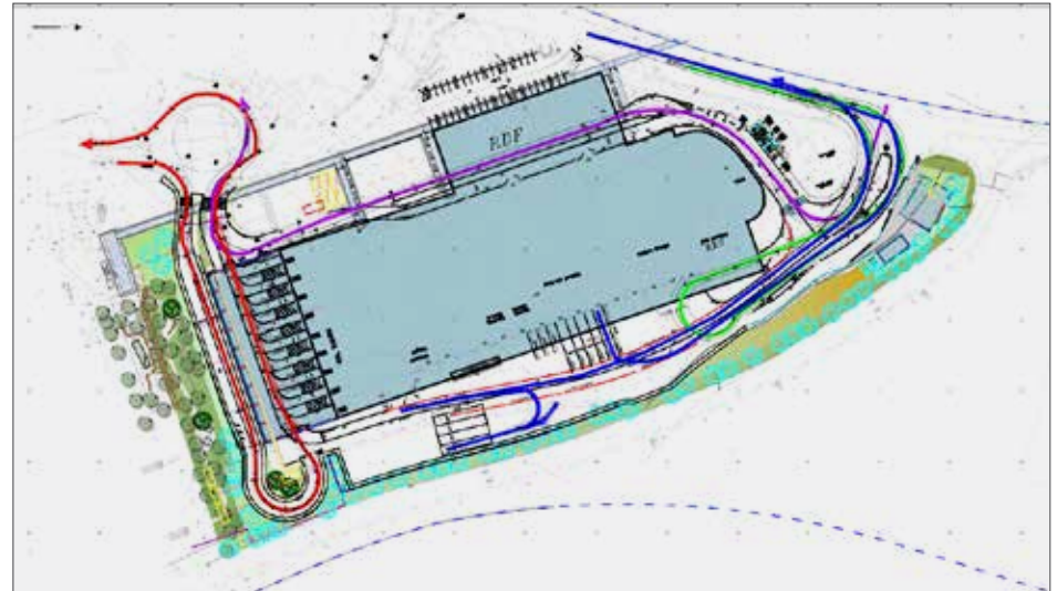
תכנית תנועה קירוי רחבת הפריקה מפעל ה-RDP