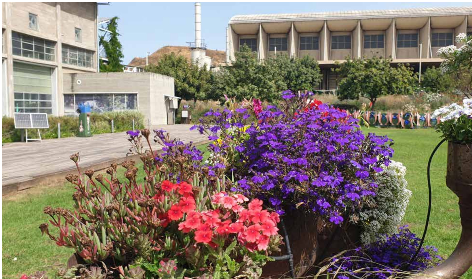
מבט לעבר המרכז לחינוך סביבתי ומפעל ה-RDF